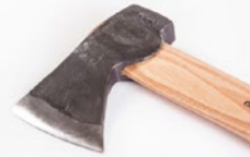
Vi har ett stort sortiment med handgjorda yxor från Gränsfors Bruk.