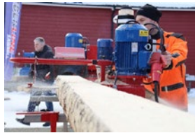
Ett flexibelt sågverk för alla - passar proffs som hobbysägare

Vi visar sågverk och Alstor 834 och försäljning av Gränsfors Yxor.