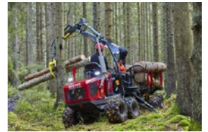
Alstor 834 Smidig miniskotare med otrolig framkomlighet

Gör ett besök och träffa oss på Lycksele marknad!